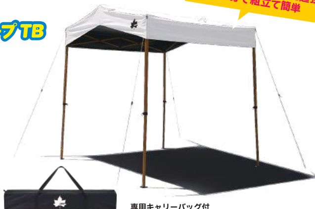
専用キャリーバッグ付