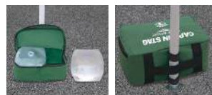
付属のタンクに水を入れて使用