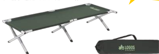
キャリーバッグ付