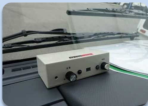
コントローラ (受信機)