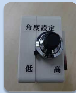
角度設定 ダイヤル