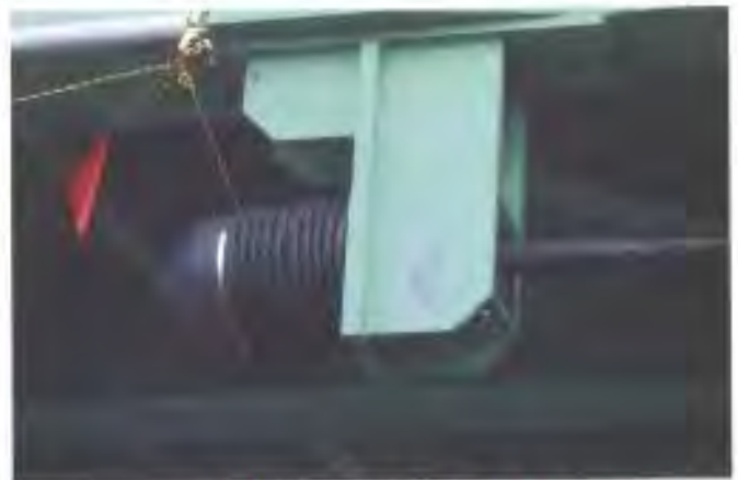
・落橋防止装置損傷状況