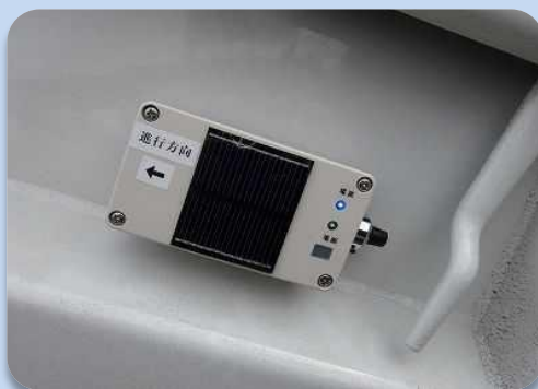
傾斜検出センサー (発信機)