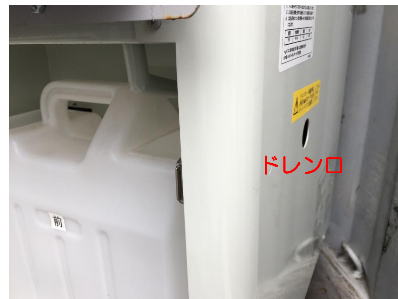
ドレンタンク周辺