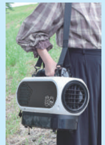
ショルダーベルト使用例