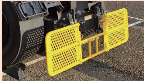
＜公道走行・転圧作業時＞