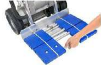
キャスター付きの荷台で 平地の移動もスムーズに