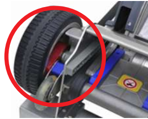
エッジブレーキシステムにより 誤作動を防ぎ落下を防止