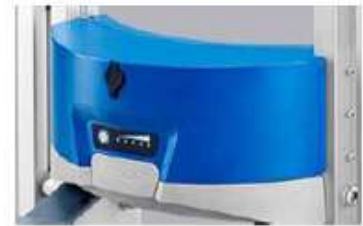
従来品より 2.5 倍性能を UP した リチウムイオンバッテリー搭載