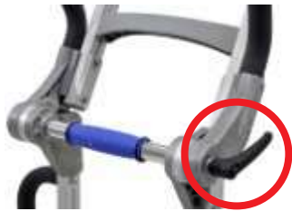
ハンドルを回して 好みの角度に調整可能