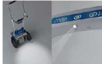
ステップライトで 暗い場所の作業も安心