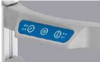
使いやすい クリアなタッチパッド