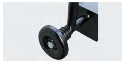
後進時の事故を防止する「デッドマン装置」(緊急停止装置)