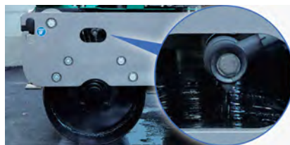
散水しながらの施工でアスファルトの貼りつきを防止する「ローラー散水機構」