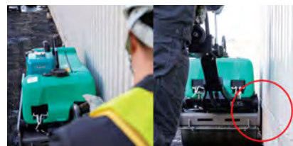
フレームとドラムの間隙が極少で位置合わせが簡単な「サイドクリアランス」