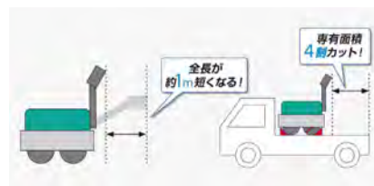
ハンドルを立てて格納でき、収納時の省スペースを可能にする「コンパクト設計」