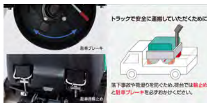
「機械式駐車ブレーキ」、駐車時に使用するゴム製「輪止め」を標準装備