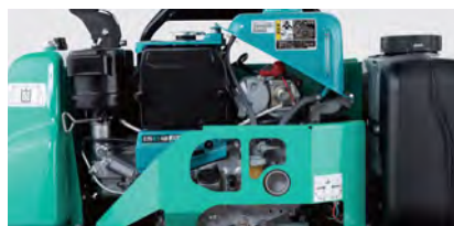
標準装備の「エンジンガード」により本体側面がフラット化。壁際の作業も楽に