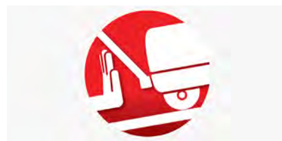
坂道で駐車した場合に作動する「坂道暴走抑制機構」