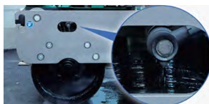
散水しながらの施工でアスファルトの貼りつきを防止する「ローラー散水機構」