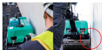
フレームとドラムの間隙が極少で位置合わせが簡単な「サイドクリアランス」