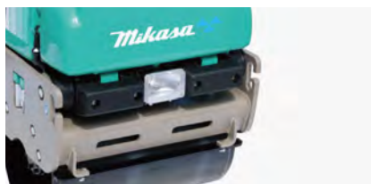
夜間作業に便利な「前照灯」、機体の損傷を防止する「ゴムバンパー」を標準装備