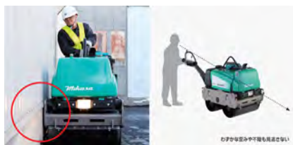
低重心設計により前方が見やすいワイドな視覚を確保した「視認性抜群のデザイン」