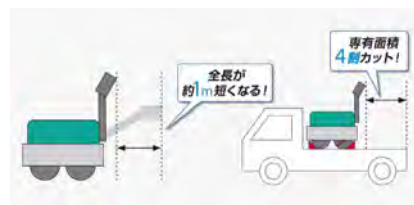
ハンドルを立てて格納でき、収納時の省スペースを可能にする「コンパクト設計」