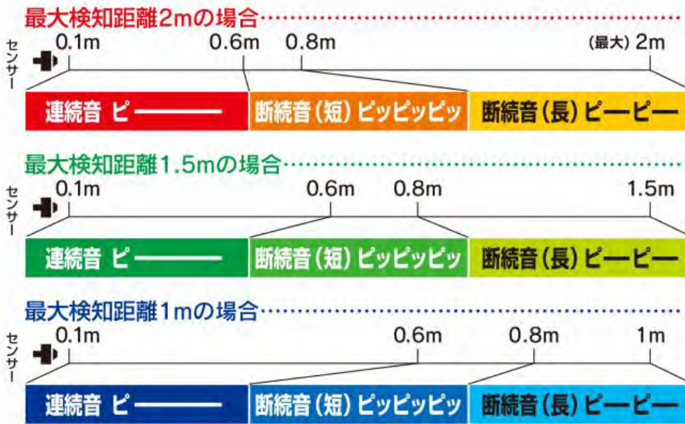
センサー検知範囲