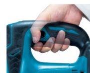
握りやすい ソフトグリップ