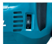
スピード調整 ダイヤル(1~6)