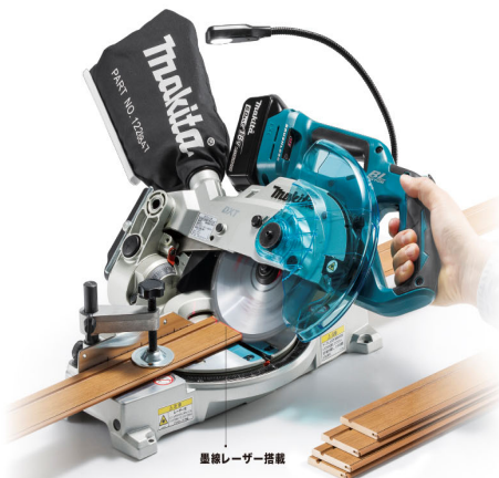
墨線レーザー搭載