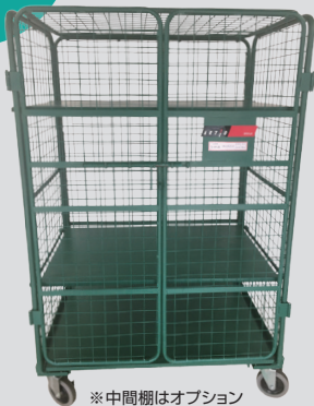
※中間棚はオプション

【充電保管庫セット】に「セキュリティラック」「中間棚」を あわせてご注文ください!