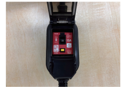
過電流/漏電ブレーカー