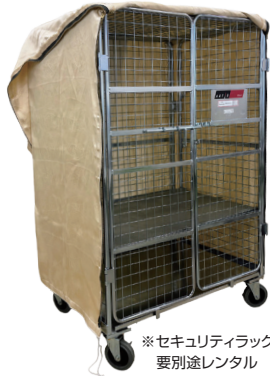
※セキュリティラックは 要別途レンタル