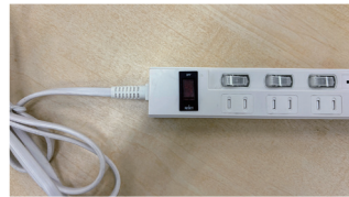
過電流ブレーカー