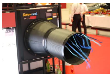
SUN GO COOL

【冷える〜む 3】冷房機能付きテント型休憩所です。アルミフレーム採用で超軽量、組み立てが簡単。さらに、テント同士を連結して広さを自由に調整できるため、用途に合わせた柔軟な空間作りが可能です。