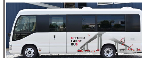
トイレ付休憩車(バス)