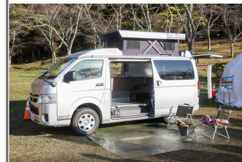
オフィスカー(ハイエース)