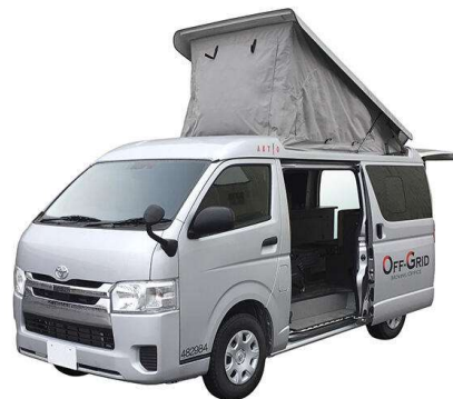
オフィスカー(ハイエース)