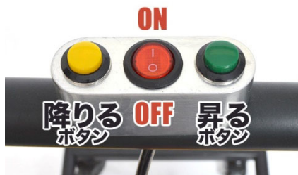
ボタン式で簡単操作