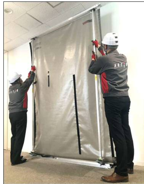
2名での組み立て風景

「マジックシャッター」は、明治商工株式会社(本社:東京都大田区)と共同で、リニューアル工事や内装解体工事の間仕切り養生を、より簡単に組み立て、解体することを目的に開発しました。工具が不要で、2名で簡単に組み立て・解体することができるため、短時間で大空間の間仕切りが可能です(18mを約30分で施工/弊社調べ)。