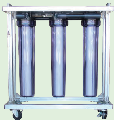
前処理フィルターユニット