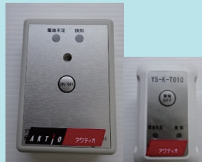
振動警報タグ ヘルメット 取付タグ