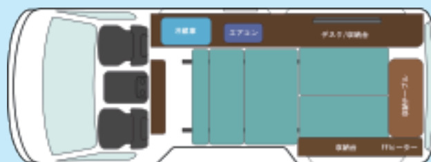
シートのベット展開時 1名就寝