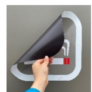
マグネット式サインボード

・中小企業事業主が屋外喫煙所の設置をした場合に受けられる「受動喫煙防止対策助成金」を受けられる給換気システムを採用(レンタル契約での設置は助成対象外)