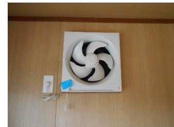
分煙用大型電動換気