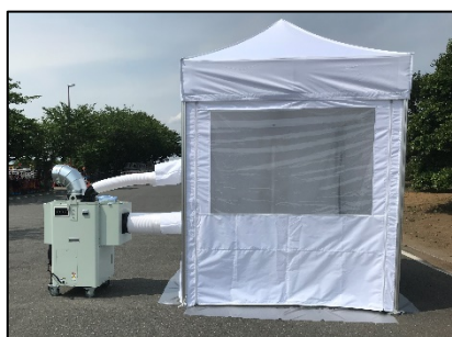
冷却テント+吊りテントあり、 使用イメージ