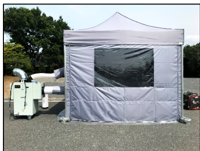
冷却テント+吊りテントあり、 使用イメージ