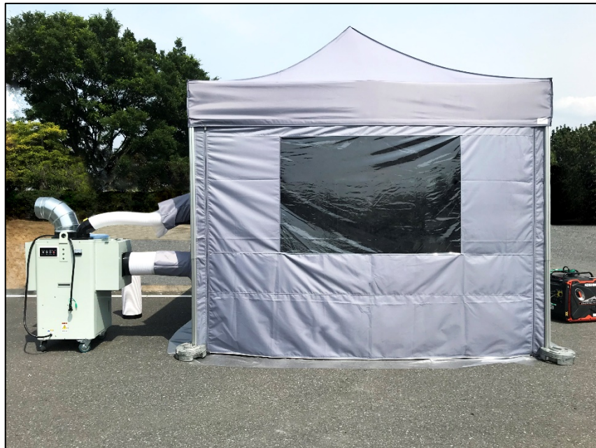
「冷える～む2」冷却テント 3(L)m×3(W)m×3(H)m

総合建設機械レンタル業の株式会社アクティオ(本社:東京都中央区日本橋、代表取締役社長兼 COO:小沼直人、以下アクティオ)は、屋内、屋外問わず簡単に設置ができる循環型1.5馬力移動式クーラー(以下1.5馬力クーラー)と簡易組立可能な冷却テント(以下:簡易テント)を組み合わせた休憩所「冷える～む2」を2020年6月中旬からレンタル開始いたします。