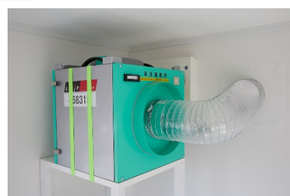
【HEPA フィルター内蔵換気装置】