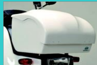
フロントボックス