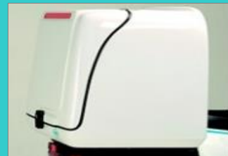
大型デリバリーボックス