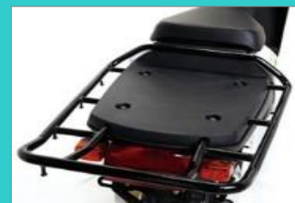
リア大型キャリア