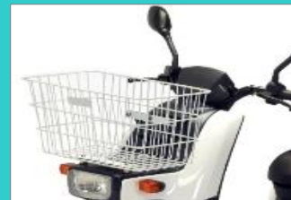
フロントワイドバスケット