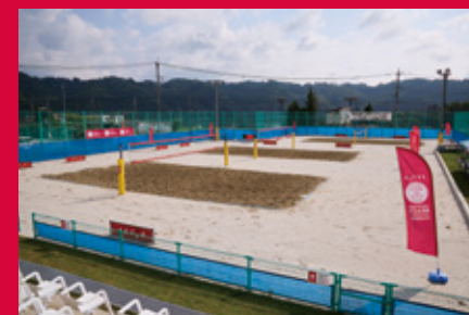
vol.3 — 2023.6.11 岐阜県海津市長良川サービスセンター